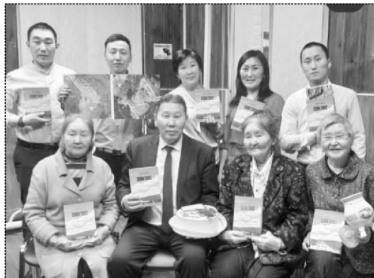
Дириҥ махталы кытта Суон Тииттэн төрүттээх тыыл, үлэ бэтэрээннэрэ, Суон Тиит бөһүөлгүн олохтоохторо.

чэгиэн-чэбдик доруобуйаны, дьоллоох-соргулаах дьонун-мааны олоҕу баҕарабыт.